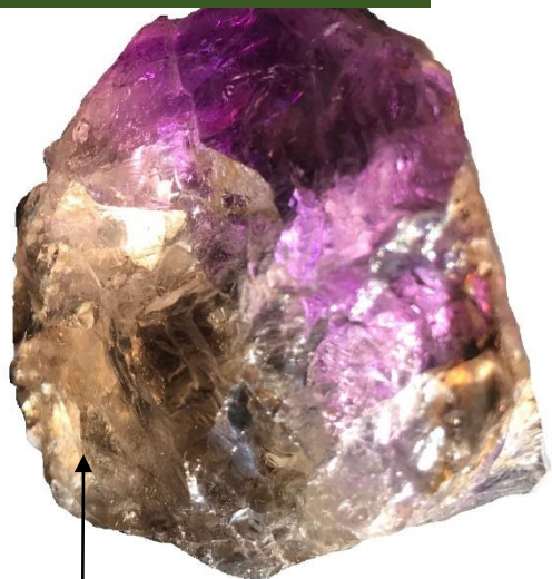
和名：紫水晶 英名：アメシスト 熊楠コレクションの中に「水晶」の標本は10点あります。