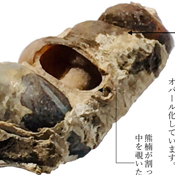
雲根志に「月のお下がり」という名で載っている「ピカリア」の化石。オパール化しています。