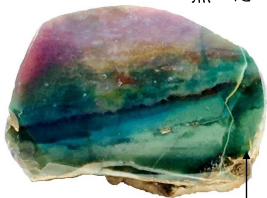
青年熊楠が東京予備門時代に神田で購入した「玉(ぎょく)」。 英名：ジャスパー

南方熊楠の筆筒に収められていた 鉱物・化石のコレクションは306点 それらを初公開