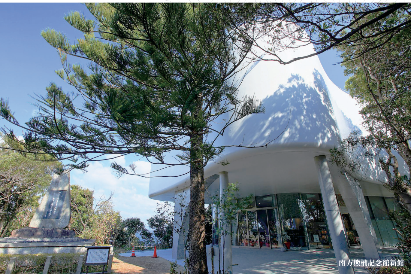
南方熊楠記念館新館