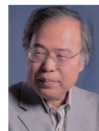
南方熊楠記念館 名誉館長

今年は南方熊楠没後80周年であり、今後とも皆様方と手を取り合いながら、記念行事の開催に向け取り組んでまいりますので、お力添えのほど何卒よろしくお願いいたします。