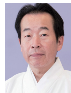
熊野本宮大社宮司